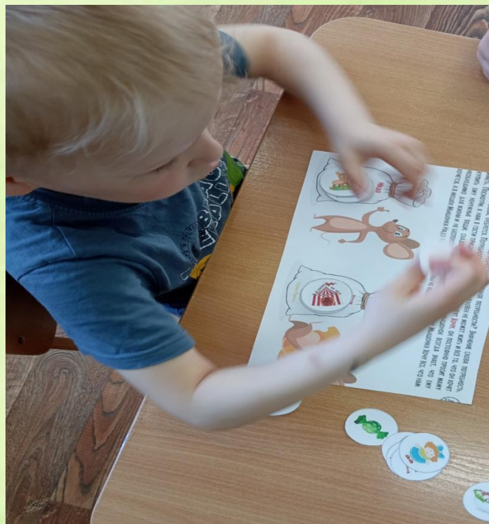
Д/и «Хочу и надо»