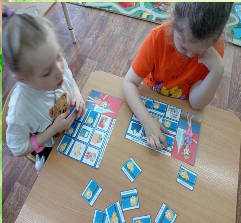
Лото « Семейный бюджет»